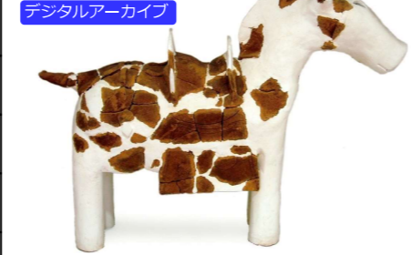
デジタルアーカイブ