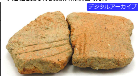
デジタルアーカイブ